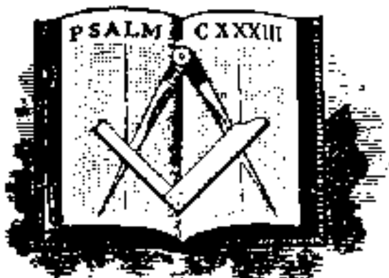
Tri Velika Svetla Slobodnog zidarstva

Šta su, dakle, simboli ove Tri Velike Svetlosti? Sastojе se, primetite, od Knjige Svetog Zakona, Ugaonika i Šestara. Uvek se prikazuju kao da su organski i nerazdvojno spojeni. Knjiga Svetog Zakona leži najniže i formira osnovu za druga dva koja leže na njemu, Šestar koji je delimično prekriven Ugaonikom.